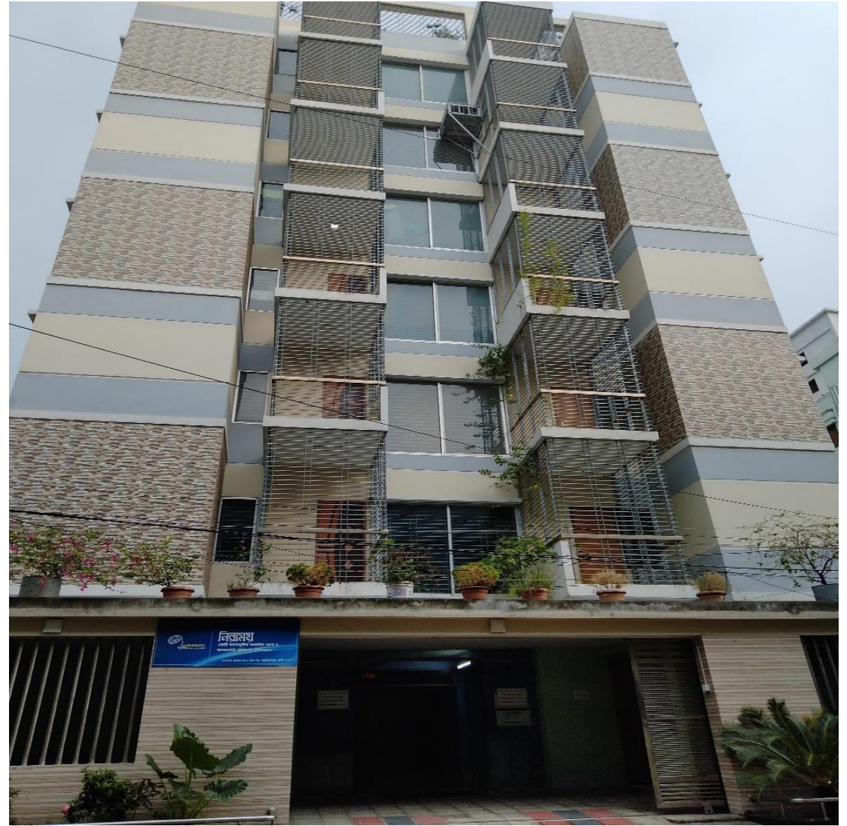
A Dedicated 7 Storey Building for the Hospital